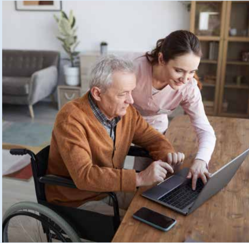
Цель реабилитации – вернуть вас полностью или частично на рынок труда, или хотя бы к более активной жизни.