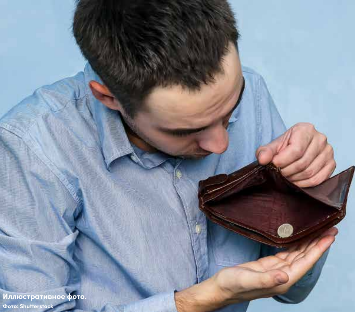
Иллюстративное фото.

Источник: Департамент социальной помощи и здравоохранения