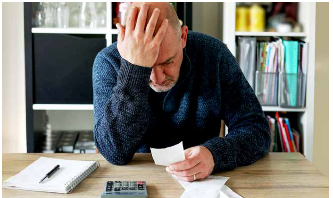
Сегодня задача любого работающего человека – это критически оценивать себя и свои навыки.